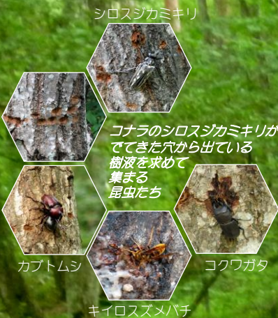
シロスジカミキリ