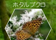
ヒョウモンチョウ