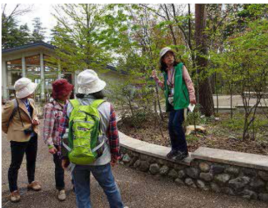
写真は昨年の様子です

あづみの学校 理科教室の公園パートナーと一緒に、教室を飛び出して春を探しに園内を巡ります。 今回のテーマは「春を探しに行こう」です。春の公園にはわくわくドキドキの発見がたくさん！ カタクリやオキナグサ等の野草や、エドヒガン、コヒガン、ソメイヨシノなどの桜を観察します。