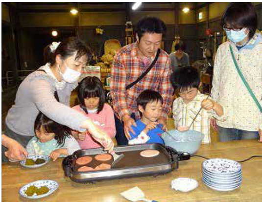
写真は昨年の様子です

毎年ご好評いただいている春の歳時記イベントを開催！ホットプレートを使って、桜餅づくりに挑戦！ こしあんを桜餅の皮で包んで、塩漬けにした桜の葉を巻いて作ります。どなたでも簡単・手軽に体験できます！