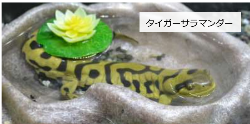
タイガーサラマンダー

あづみの学校理科教室では、干支にちなんだ生き物を特別展示しています。からだか虎模様の「タイガーサラマンダー」や、「タイガープレコ」「クラウンローチ」などのお魚をご覧ください。