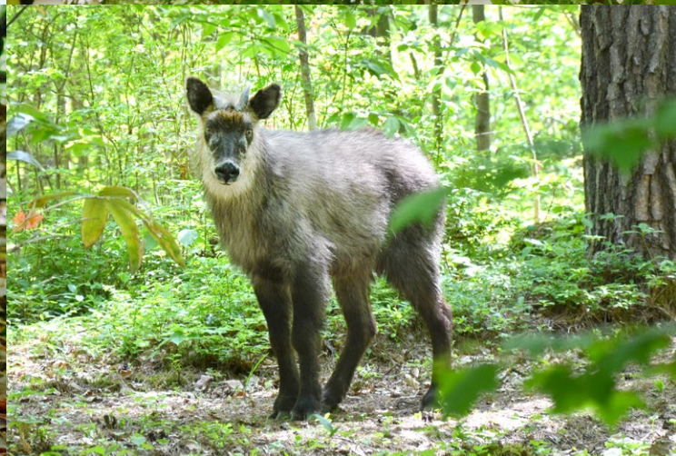
▲乳川の河畔では、カモシカが水を飲みに来る時があります。タイミングが良ければ突然出逢えるかもしれませんね。