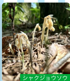
シャクジョウソウ