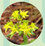
ツルマンネングサ