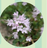
イブキジャコウソウ