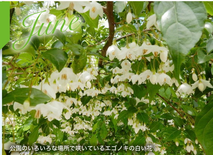
公園のいろいろな場所で咲いているエゴノキの白い花

梅 雨の合間に広がる空の青と草原を渡る風に、清々しさを感じる時季になりました。公園の散策路や溪流沿いでは、雨で濡れた樹皮や梢の緑が深みを増し、森の香りが満ちて清涼感があります。ハルゼミの声も響き始め、樹々のあいだを飛び交う野鳥の姿やさえずりも聞こえてきます。エゴノキ・ネジキ・サワフタギなどが白い花をつけ、山野草の可憐な姿も見られます。みなさんも、サポーターの案内で公園の花たちを訪ねてみませんか。