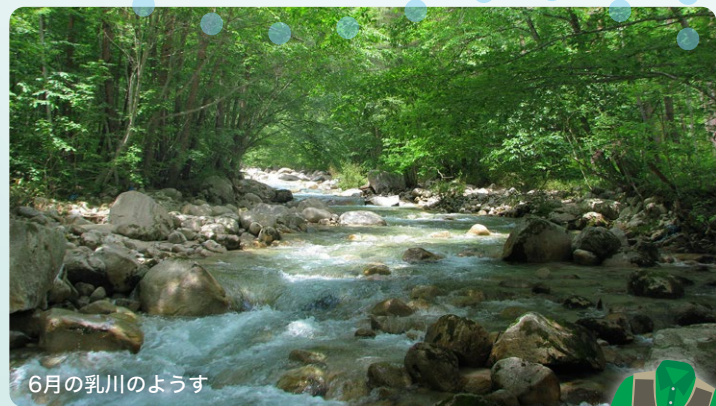
6月の乳川のように