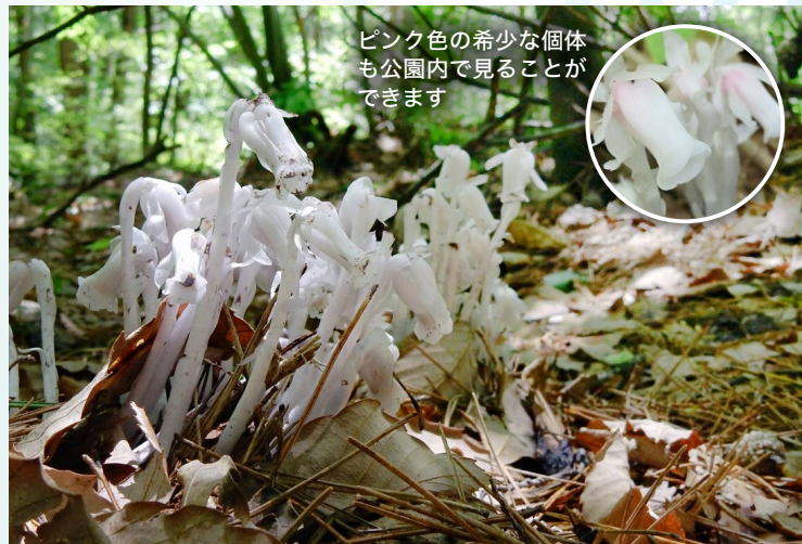
ピンク色の希少な個体も公園内で見ることができます