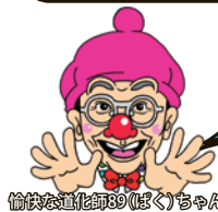
愉快な道化師(ぼく)ちゃん

3/29(土) 11:00~11:40 13:30~14:10 「コメディパフォーマンス& かみしばい劇場」