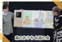
森のおうちお話の会