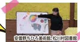
安曇野ちひろ美術館、松川村図書館