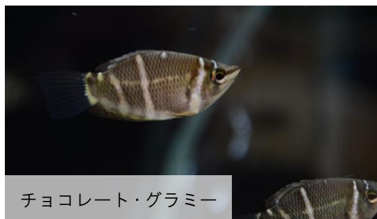
チョコレート・グラミー